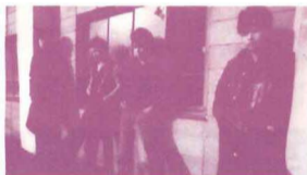
▲5日(水) THE ECHOES